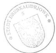
Paul Köhne Bürgermeister