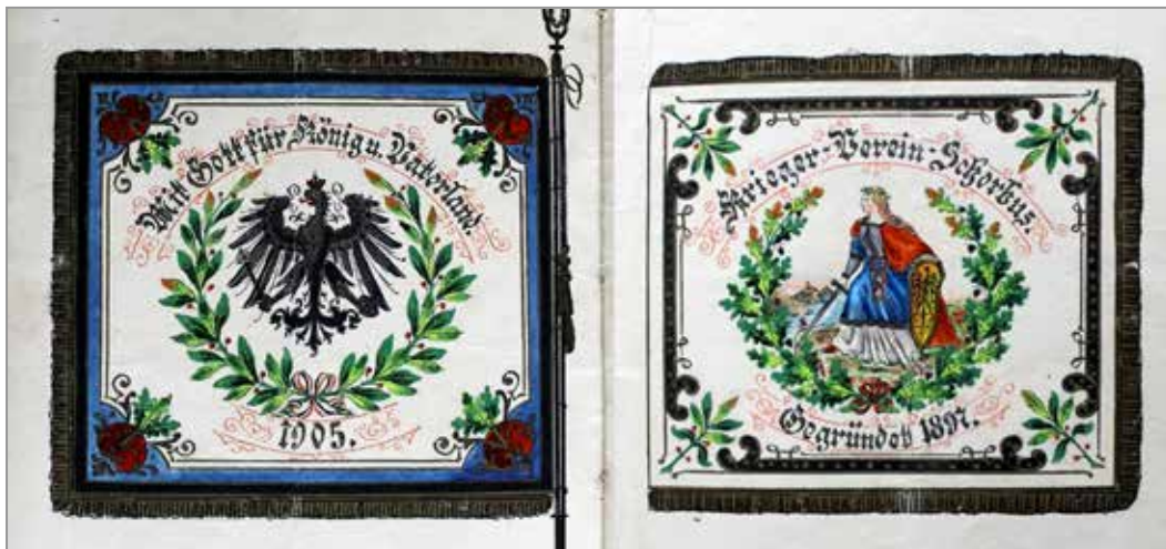
Die Fahne des Schorbuser Kriegervereins zeigt auf der Vorderseite die mit Eichenlaub bekrönte und bekränzte Germania vor einer Rheinlandschaft, Schwert und Schild tragend, westwärts dem Feind zugewandt. Die Rückseite trägt den mit Lorbeer umkränzten preußischen Adler unter der 1813 von Friedrich Wilhelm III. kreierten Devise.

Gedient zu haben, war Pflicht. § 2. der Satzungen verlangte den Dienst im »stehenden Heere oder der Marine«, den »Vollbesitz der bürgerlichen Ehrenrechte« und einen »achtbaren Lebenswandel«. Als Dienstgrade führt das Mitglieder-