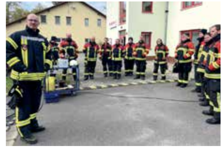
Impressionen der Truppmannausbildung 2023.