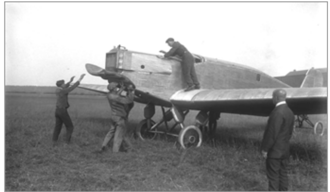
Am 12./13. April 1928 flog eine Junkers W33 erstmals nonstop von Ost nach West über den Atlantik, Flugzeit 36,5 Stunden.