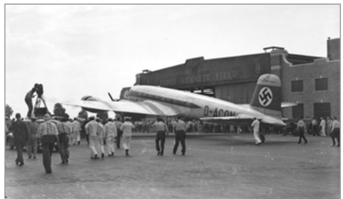
Erst am 10./11. August 1938 fand der erste Nonstop-Flug von Berlin nach New York statt, Flugzeit 25 Stunden. Foto: Floyd Bennett Airfield Brooklyn.

(DS, Quellenmaterial: Stadtarchiv Drebkau, Fotos: Wikimedia Commons, NY Aktuell)