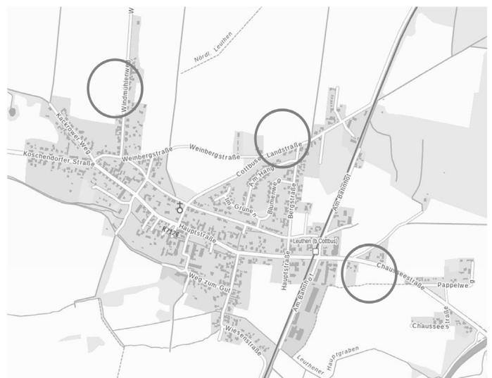
1. Änderung der Klarstellungs- und Ergänzungssatzung der Stadt Drebkau/Drjowk für den Ortsteil Leuthen/Lutol Übersichtsplan der Änderungsbereiche 1 bis 3