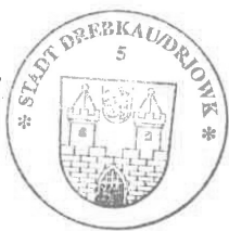
Paul Köhne Bürgermeister

Ende der Bekanntmachungen der Stadt Drebkau/Drjowk