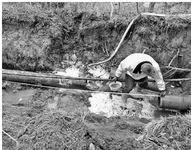
Bildtext: Den letzten Rohrschaden im Bereich Golschow gab es Anfang Februar. Nun wird die Leitung ausgetauscht.

Während der Baumaßnahme, die ca. 3 Wochen dauern wird, bleibt die Straße größtenteils befahrbar. Bei Bedarf kann die Umfahrung im Bereich Golschower Dorfstraße 36-40 genutzt werden. Eine Beeinträchtigung der Wasserversorgung wird es für die Einwohner nur kurzzeitig geben, wenn die Hausanschlüsse von der alten auf die neue Leitung umgebunden werden. Darüber werden sie rechtzeitig durch die LWG informiert.