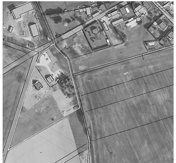
Übersichtsplan zum vorhabenbezogenen Bebauungsplan „Wohngebiet am Steinitzer Wasser“

Der Aufstellungsbeschluss wurde einstimmig gefasst. Gemäß § 2 Absatz 1 Satz 2 BauGB wird dieser Beschluss hiermit bekannt gemacht.