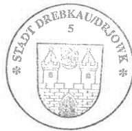
Paul Köhne Bürgermeister