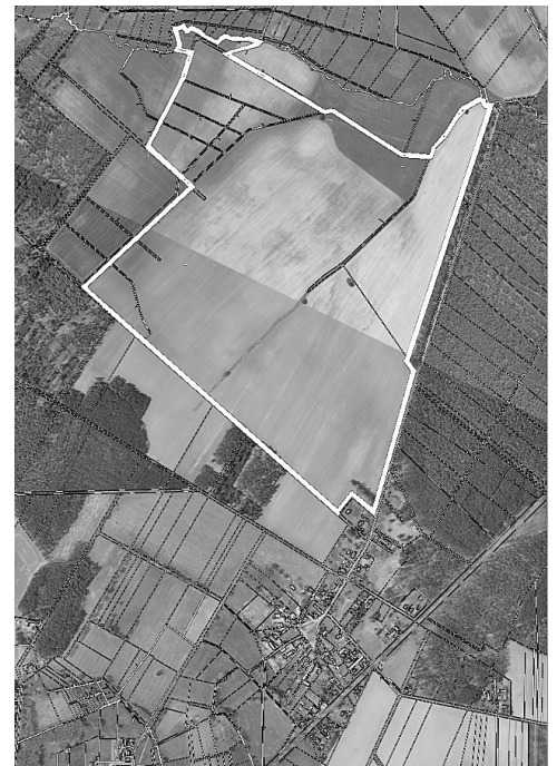
Übersichtsplan zum vorhabenbezogenen Bebauungsplan „Energiepark Golschow“

Der Aufstellungsbeschluss wurde einstimmig gefasst. Gemäß § 2 Absatz 1 Satz 2 BauGB wird dieser Beschluss hiermit bekannt gemacht.