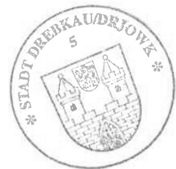
Paul Köhne Bürgermeister