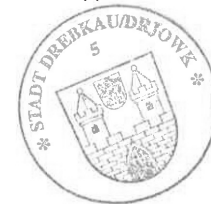
Paul Köhne Bürgermeister