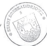
Paul Köhne Bürgermeister