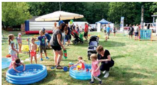
Am Samstag, den 3. September 2022, lädt die LWG zum „Tag der offenen Tür“ in das Wasserwerk Cottbus-Sachsendorf ein und bietet ein buntes Programm für die ganze Familie. (Foto: LWG-Archiv).

Marina Röwer Öffentlichkeitsarbeit LWG Lausitzer Wasser GmbH & Co. KG