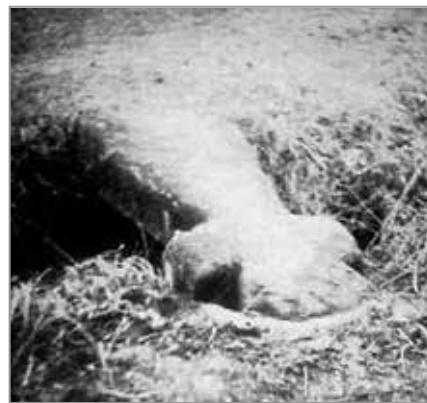
1,42 m hoch, 63 cm breit – das Greifenhainer Sühnekreuz: links 1925 als »Brücke« über ein Fließ, unten 2022 als Denkmal. Das Kreuz steht am Waldrand ca. 500 m vor dem Ortseingang Greifenhain in Richtung Radensdorf.

Wenn es sich so zugetragen hat, verdiente das Kreuz in beiden Fällen die Bezeichnung »Sühne« nicht, denn dann hätte es die »Täterpartei« aufstellen lassen müssen und nicht der Bürgermeister oder die schöne Marie. Alles nur Sage? – Das Kreuz stand über Jahrhunderte am Tatort, dann diente es zweckentfremdet und pietätlos als »Brücke« über das benachbarte Fließ. Vor 1933 wurde es wieder aufgerichtet und erhielt den Status eines Bodendenkmals, aber bei Kriegsende walzte ein Panzer das Denkmal nieder. Kinder fanden es in den 1980er Jahren. Man ließ es erneut aufstellen, jedoch ohne fachgerechte Verankerung im Boden, sodass es sich bald