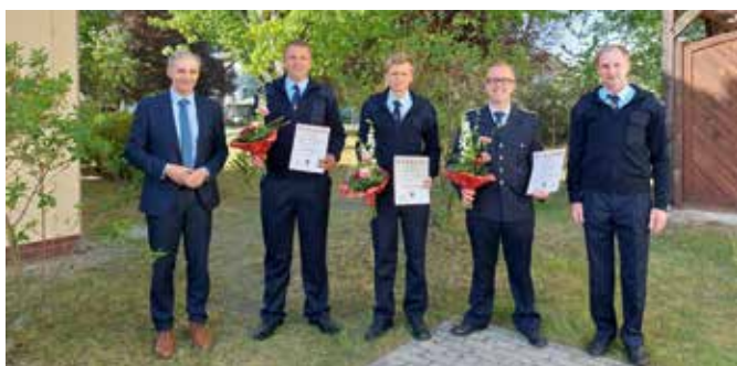
Am 12.05.2022 wurden an die neue Ortswehführung Drebkau/Kausche die Bestellsurkunden überreicht - von li.n.re.: Bürgermeister