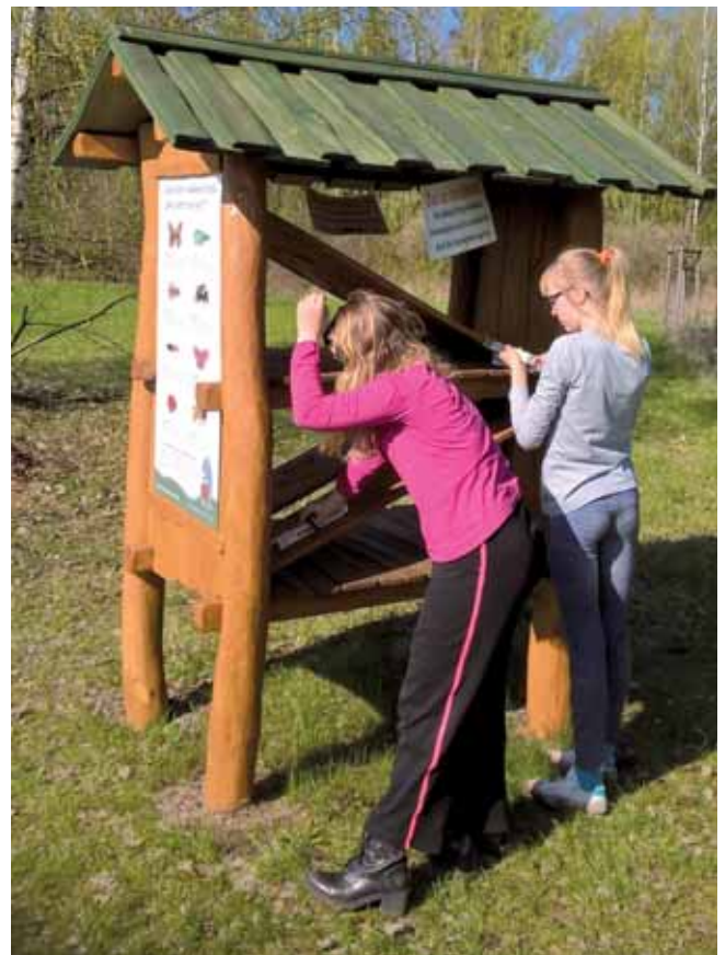
Foto: Kinder beim Messen der Räume