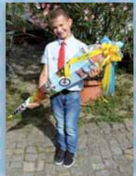
Rehnsdorf, September 2016