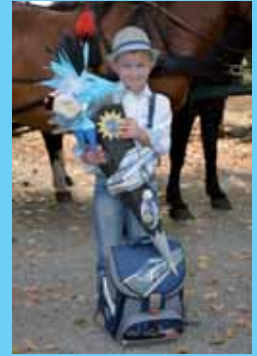
Drebkau, September 2016