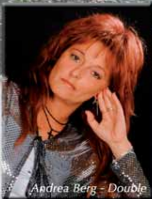
Andrea Berg - Double