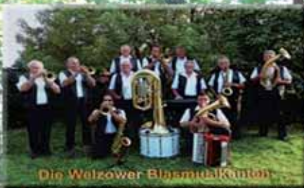
Die Wetzower Bläsermusikanten