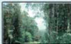
„Schöne Aussicht“ bei Steinitz