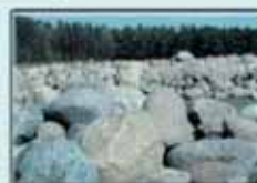
Feldsteinmauer in Steinitz