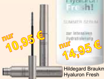
Hildegard Braukmann MASCARA