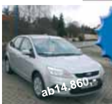
Focus Concept 5-türer (silber) UPE 20.880,- jetzt 14.860,-

Raakower Teichstr. 8 03116 Drebkau Tel/ Fax: 03 56 02/ 817 www.weller-reisen.de