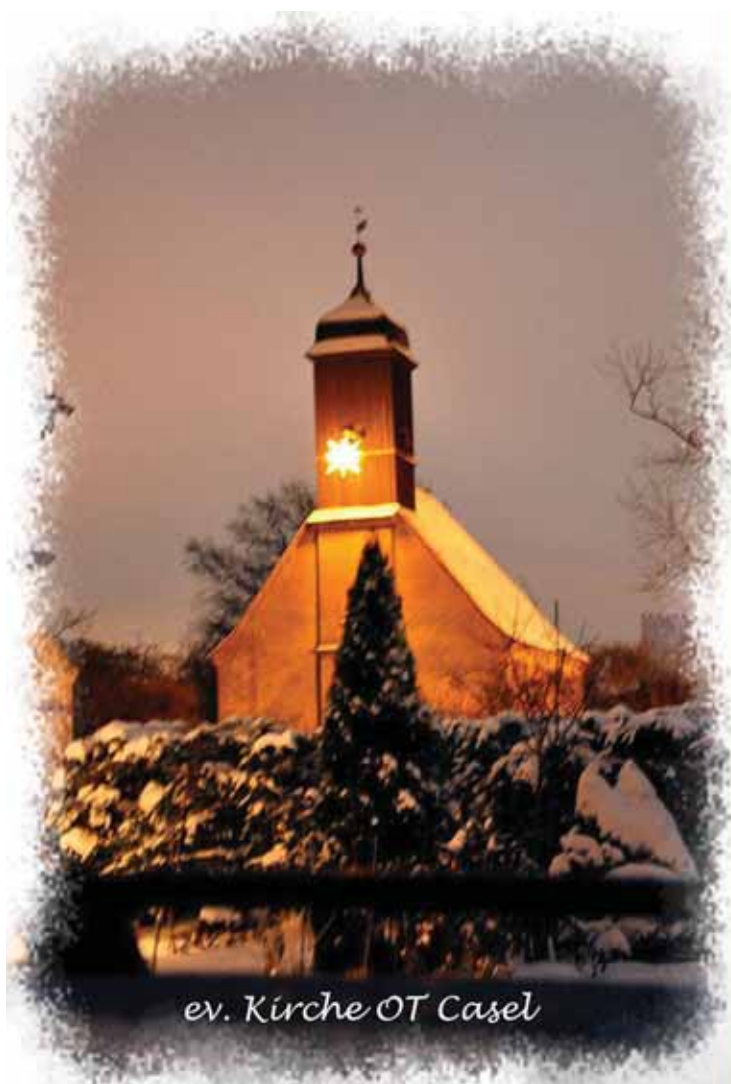
ev. Kirche OT Casel