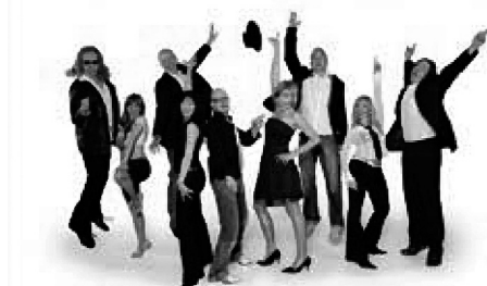
Neben attraktiven Programmeinlagen wird SUEN, eine Coverband der Extraklasse, für beste Stimmung sorgen!