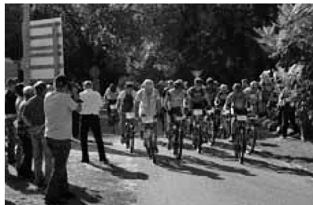
Rennstart zum MTB-Cup im Jahr 2009

Anmeldung zum Rennen und Preisrätselaktion laufen bereits. Mehr Infos, alle Formalitäten für die Mountainbike-Rennen unter www.steinitz-events.de ! Dort wird in der kommenden Woche auch das gesamte Programm veröffentlicht.