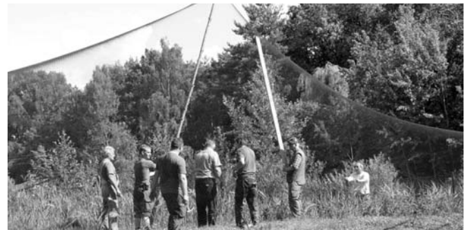
Die Jäger beim Bau der fast 3.000 Quadratmeter großen Voliere.

Ihre Helegemeinschaft Koselmühle Aufgeschrieben von Volkmar Küch Kontakt: Telefon: 035602-22151, E-Mail: info@t-buchholz.de