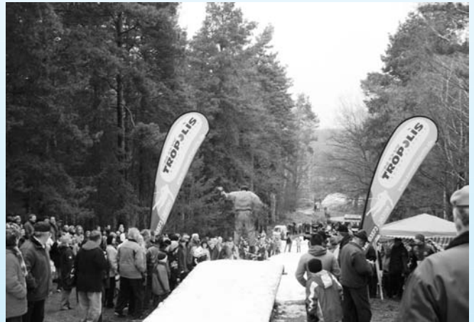
Waghalsige Sprünge begeisterten das Publikum beim Steinitzer Skifliegen im letzten Jahr.