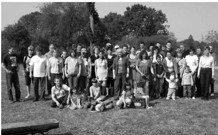
Gruppenfoto unter dem Maibaum