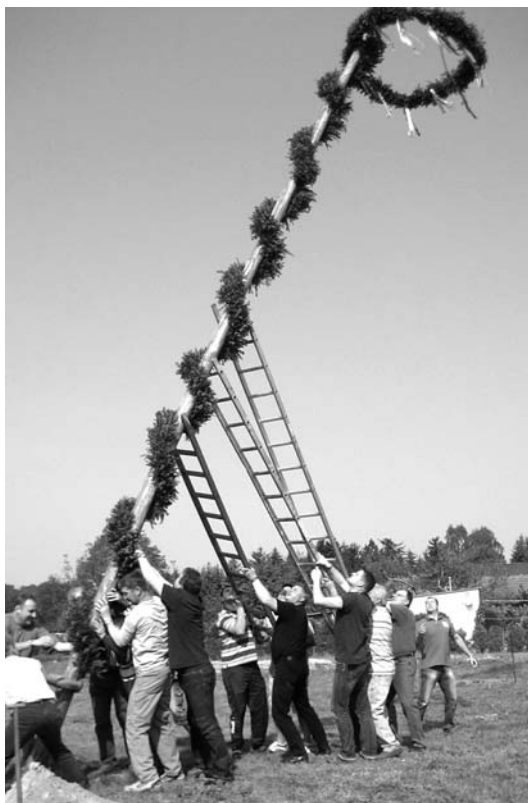
Der Maibaum wird mit vereinten Kräften aufgestellt