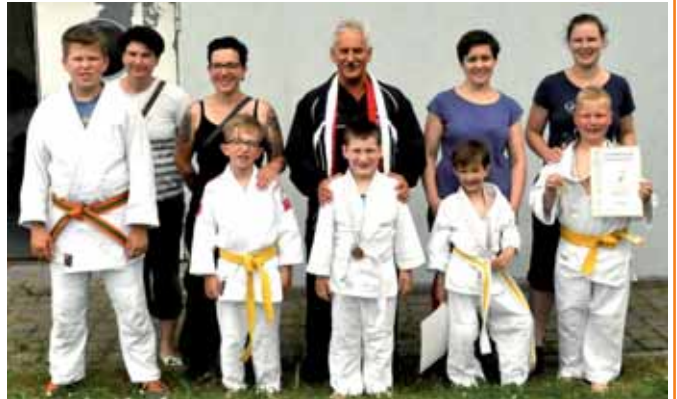
Teilnehmer, Eltern und Trainer nach der Siegerehrung